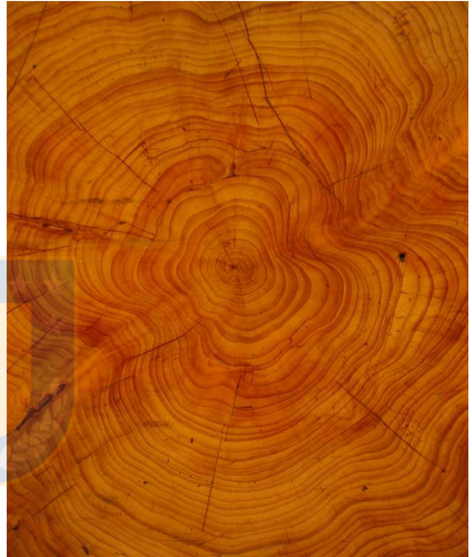
Figura 1 Sección de tronco http://www.unav.edu/

Hoy en día la madera ha alcanzado un mayor grado de industrialización que en el ejemplo utilizado, es por ello que este seminario recoge diferentes ejemplos de sistemas constructivos y los casos en los que han sido llevados a cabo, dándole énfasis a las debilidades que presenta este tipo de construcciones en altura, y su comportamiento en zonas sísmicas debido más que nada a la poca experiencia e información que hay al respecto.