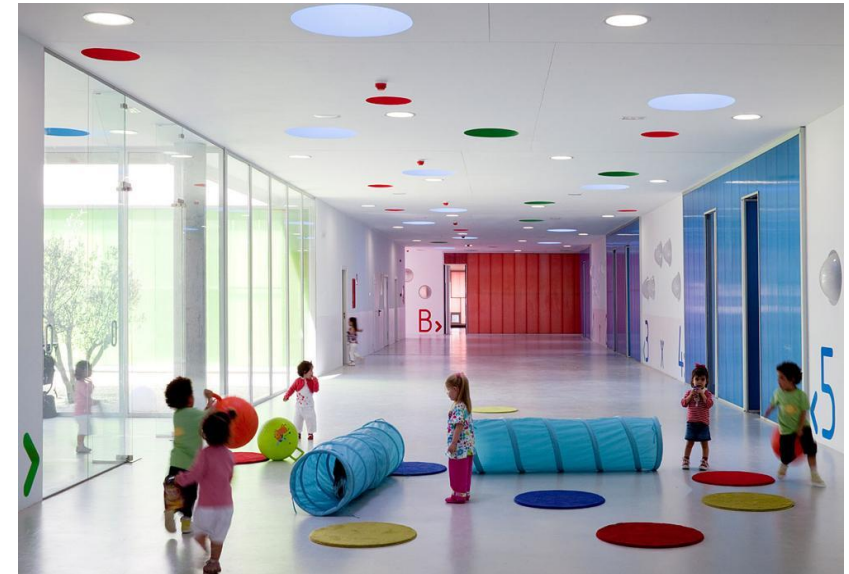
Escuela infantil Pablo Neruda. Alcorcón España Rueda Pizarro Arquitectos

Lograr una arquitectura en donde los niños puedan aprender mediante el contacto con la naturaleza, que puedan vivir fantasías, desarrollar su imaginación, incentivar el juego como parte importante de su desarrollo. En fin, un lugar donde se logre cubrir necesidades fisiológicas, psicológicas, sociológicas y pedagógicas de cada pequeño.