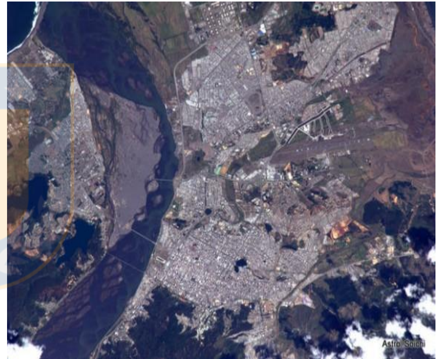
Imagen aérea Concepción / San Pedro de la Paz

área metropolitana en los últimos años, destacando el uso marcadamente residencial, sin por ellos soslayar las grandes expectativas de desarrollo en los servicios y la industria.