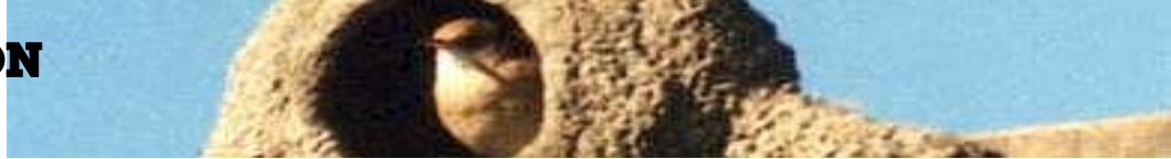
IMAGEN NIDO.