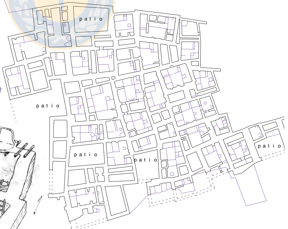
FIG. A: PLANO CATAL HUYUK.