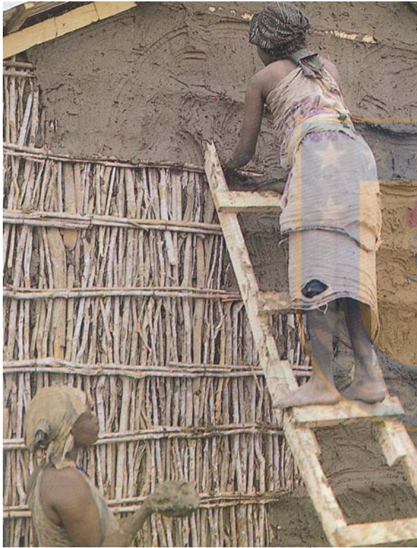
CONSTRUCCION DE UNA CASA EN SOMALÍA.

http://www.fotosaves.com.ar/Passeriformes/Furnariidae/FotosFurnariidae.html