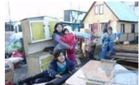
Foto 2. Erradicación.

Es en el proceso de erradicación en el que se enfocará el estudio, debido a que deben insertarse en una trama establecida y son ellos los que provocan los impactos que motivan un interés particular sobre el tema.