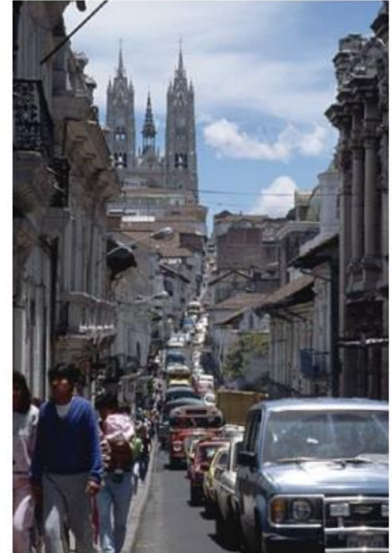
Atasco de tráfico en Quito, Ecuador 3

de los recursos económicos dan como resultado ciudades cada vez más funcionales, más artificiales, más agresivas y por sobre todo: más dañinas.