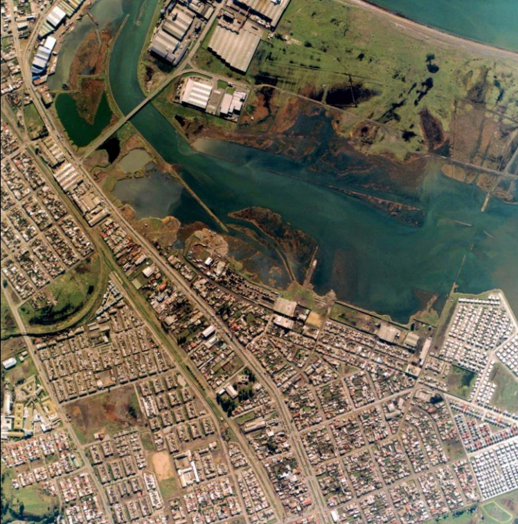
Fotografía, Talcahuano, Canal El Morro e Isla Rocuant. Chile.