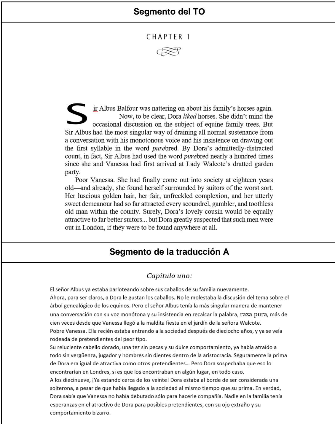
Tabla 17: ejemplo de compromiso al parámetro de disposición