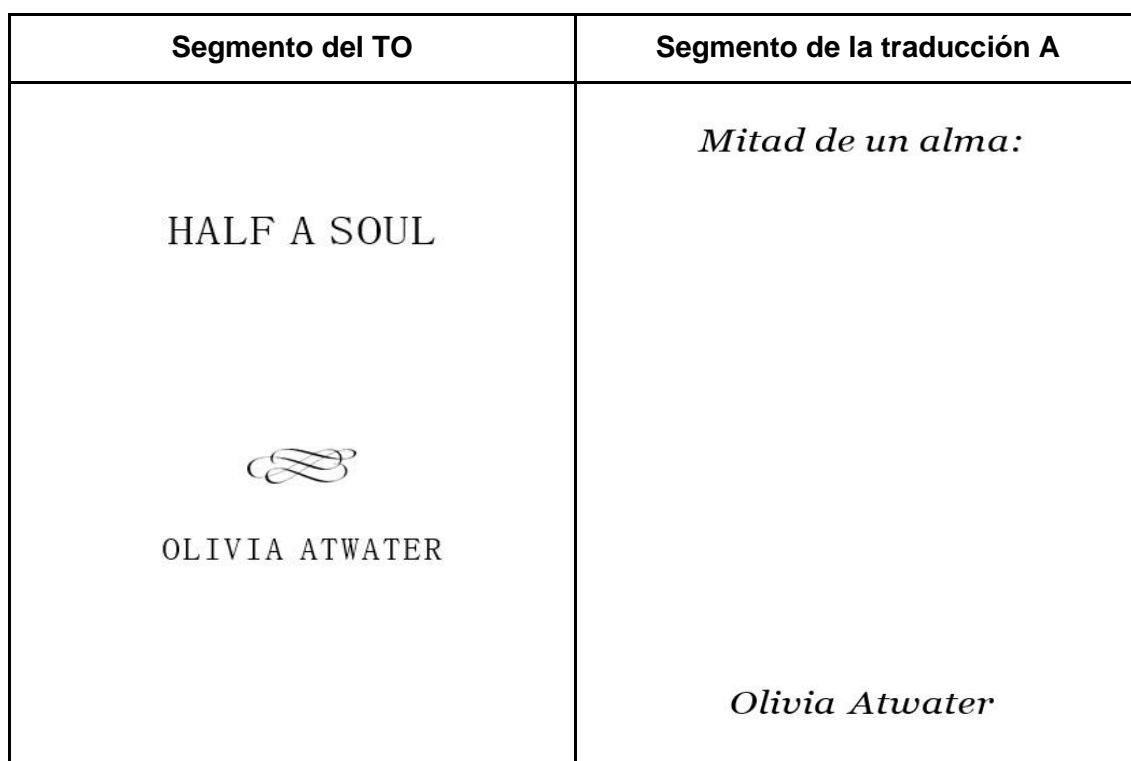
Tabla 18: ejemplo de compromiso al parámetro de compaginación

En la Tabla 18 se identifica un problema asociado al parámetro de compaginación, ya que la traductora A no replicó el formato del TO y añadió “:” en el título, lo cual podría confundir al lector, debido a que las estructuras son diferentes. Además, en el TM no se encuentra la figura debajo del subtítulo (véase el anexo para consultar otros ejemplos).