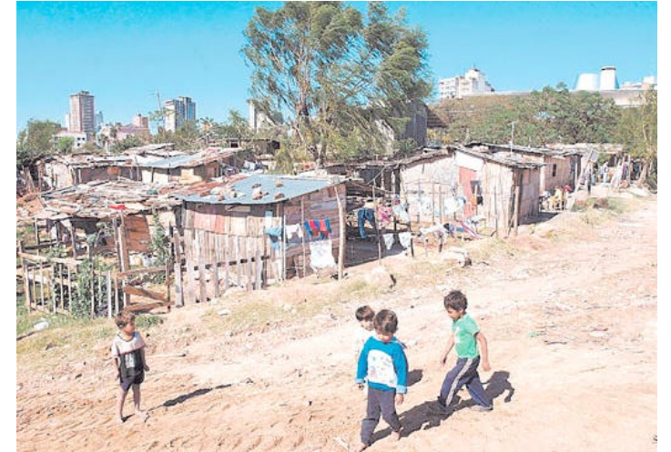
Imagen 01: Fotografía de niños jugando en una barriada pobre de Asunción, Paraguay, a 50 m de la sede del congreso.

La presencia de estos terrenos vacíos en el centro de las ciudades, dotados de infraestructura y servicios, no solo produce la degradación del contexto circundante, sino que, además, esta provocando complejos problemas sociales, al generarse poblaciones cada vez más alejadas y desprovistas de servicios básicos, "la