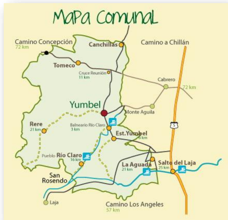
Ilustración 4 Mapa comunal de Yumbel

En Yumbel según el CENSO 2002 la zona urbana se divide en seis lugares principales, siendo el pueblo de Rere una de ellas, la cual según el censo del 2002 tiene 398 habitantes, siendo 198 hombres y 209 mujeres. En cuanto, a la zona rural se divide en 9 distritos, siendo la localidad de Campon parte del distrito N°4 con una población de 117 habitantes, los cuales 62 son hombres y 55 son mujeres. (PLADECO YUMBEL, s.f.).