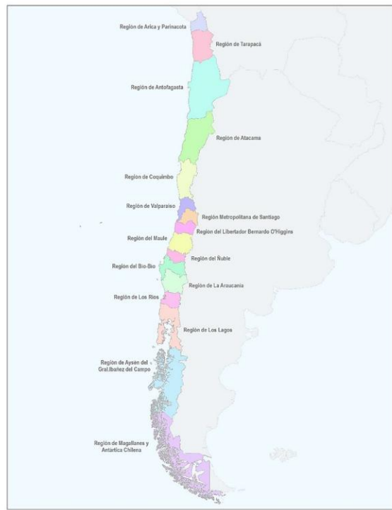
Ilustración 1 Mapa de Chile

En la actualidad, Chile es un país que se divide en 16 regiones, en donde su población según el Censo (2017) es de 17.574.003, teniendo una mayor concentración de población en la región Metropolitana (40,5%), la región del Biobío (11,6%), y la región de Valparaíso (10,3%). (Censo, 2017).