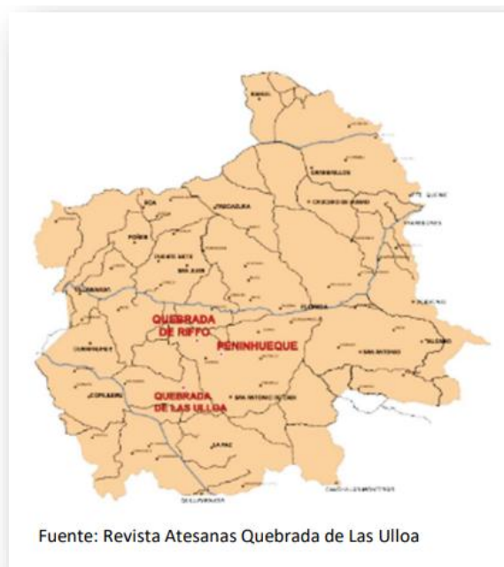
Ilustración 3 Mapa sector de artesanas en greda comuna de Florida, Biobío

La tradición que mantienen se remonta a la cultura mapuche, época en donde las mujeres mapuches producían ollas y otros utensilios para el hogar, sin embargo, con la llegada de los españoles, y debido al mestizaje, hubo cambios en la fabricación y en su producción, esto se debió a que hubo nuevas oportunidades de comercialización. (Zaldívar, 2017).