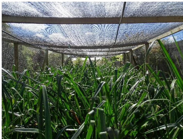
Figura 5: Sombreadero de ñocha en el sector de Paicaví chico, Huentelolén, Cañete.

“Eso uno lo recolecta conforme al clima. Por ejemplo, hay un tiempo que no se puede recolectar la paja, porque florece. El coirón tampoco se puede buscar en invierno, porque llueve mucho. Entonces ahí se trabaja con la otra fibra y así, se va como cambiando. ¿Se va cambiando según la estación? Exacto. La amófila sale en el mar, y hay un tiempo que se recolecta que es en noviembre y diciembre, y después igual florece.” (058CAÑ1FVE)