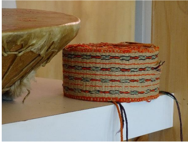
Figura 3: Trariwe en exposición en tienda Relmu Witral, Tirúa.