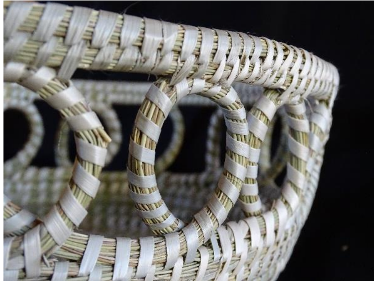
Figura 6: Panera, Huentelolén, Cañete.

“Son puntos diferentes que uno hace, por ejemplo, ese es punto abierto y estos son puntos tupidos, que no se ven lo que va dentro. Punto tupido, el punto embarrilado que va así.” (058CAÑ1FVE).