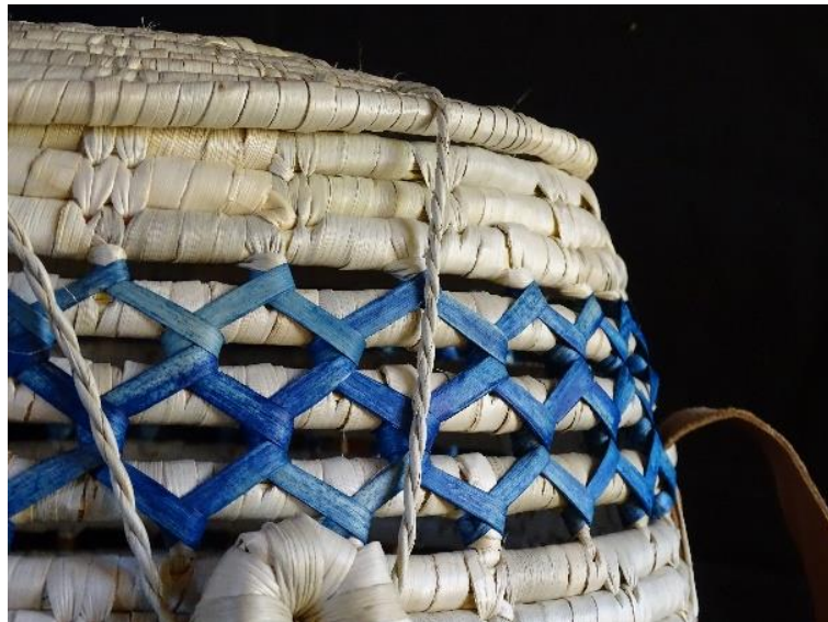
Figura 7: Canasto con fibras teñidas, tapa y correa de cuero, Huentelolén, Cañete.