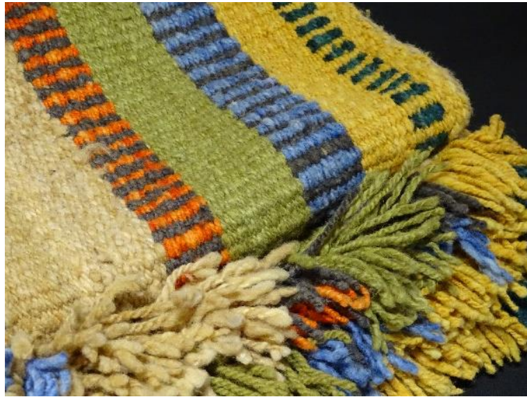
Figura 4: Bajada de cama. Escuela de artes y oficios, Cañete.