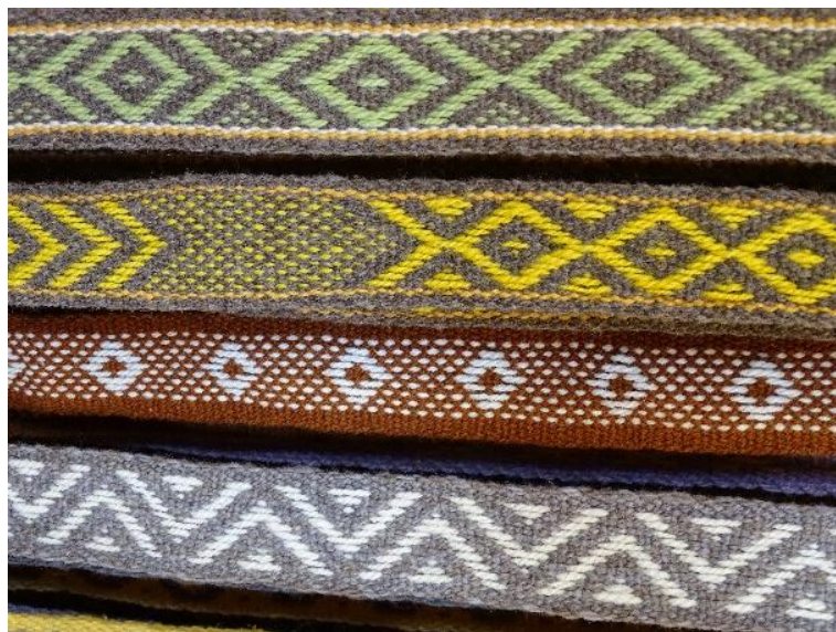
Figura 2: Trarilonko en exposición en la tienda Relmu Witrál, Tirúa.

“la hoja de maqui se puede teñir, pero cuando se está cayendo, la hoja se pone media amarilla es bueno cosecharla y teñirla, da otro tono, igual ahora que está brotando, sale, pero bien verde, y con el fruto se tiñe el violeta (...) el rojo es difícil de sacar, de la beterraga lo han tratado de sacar, pero no, es difícil, del fruto del peumo también, pero da como concho de vino. (...) El café se saca, bueno, yo la última vez lo saqué de Palo Santo, de la corteza de Palo Santo, pero fue casualidad que me encontré con ese. (...) El castaño da como un color anaranjado. ¿Ya y lo usan? Sí también, pero por aquí hay poco castaño. Y en eso que teníamos, dijo otra cosa. De ratonera y con barba de la mutilla. Y de ese debe haber montones, ¿no? Sí, sí, por ejemplo, el falso té, una hierba que todo el mundo odia, porque es muy abundante, y da un color mostaza muy lindo” (001CAÑ1FVE).