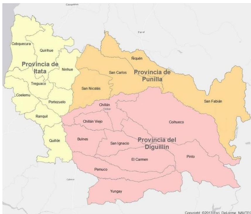
Figura 1. Mapa del área de estudio, Región de Ñuble.

La región de Ñuble se localiza en las coordenadas 36°00 y 37°12' de latitud sur, la cual limita al norte con la Región del Maule, al sur con la Región del Biobío, al oeste con el océano pacífico y al este con la republica de Argentina (BCN, s.f.). Esta región fue creada mediante la ley N°21.033 por el Ministerio del Interior y Seguridad Publica, 2017, en la cual conforman, además, las provincias, las cuales son Diguillín, Punilla e Itata (ver Figura 1). Formada por un total de 21 comunas en donde la capital es la ciudad de Chillan y su superficie aproximada es de 13.178 km 2 (BCN, s.f.).